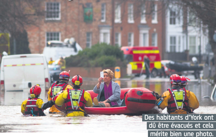
Des habitants d'York ont dû être évacués et cela mérite bien une photo.

GRANDE-BRETAGNE Le premier ministre britannique, David Cameron, s'est déplacé hier dans les zones affectées par les inondations dues aux pluies diluviennes qui ont balayé le nord de l'Angleterre ces derniers jours. Particulièrement touchée, la cité historique de York, située à la confluence des rivières Ouse et