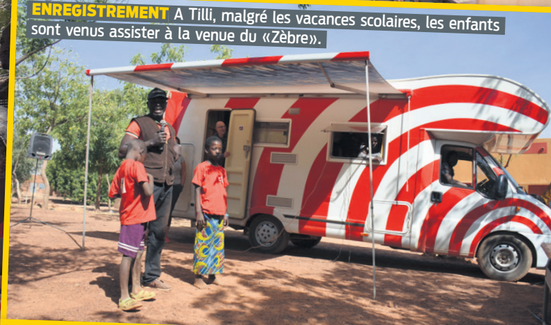
ENREGISTREMENT A Tilli, malgré les vacances scolaires, les enfants sont venus assister à la venue du «Zèbre».