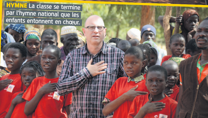
HYMNE La classe se termine par l'hymne national que les enfants entonnent en chœur.