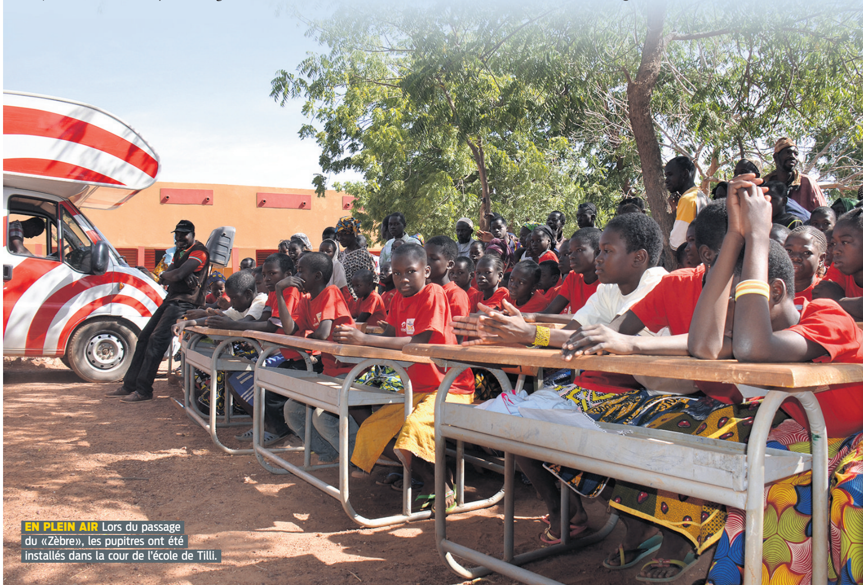
EN PLEIN AIR Lors du passage du «Zèbre», les pupitres ont été installés dans la cour de l'école de Tilli.

Voir la galerie photos: zebre.lematin.ch