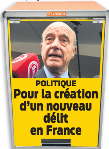
Alain Juppé Candidat à la primaire des Républicains

Le maire de Bordeaux estime que la mesure d'extension de la déchéance de la nationalité est «inutile». Juste un «coup politique» de François Hollande. Alain Juppé prône en revanche l'introduction d'un nouveau délit, celui «d'entrave à la laïcité dans les services publics». Quèsaco? Juppé donne l'exemple d'une femme musulmane qui refuserait de se faire soigner par un médecin homme. Et ça, c'est pas un «coup politique»? ● VALÉRIE DUBY