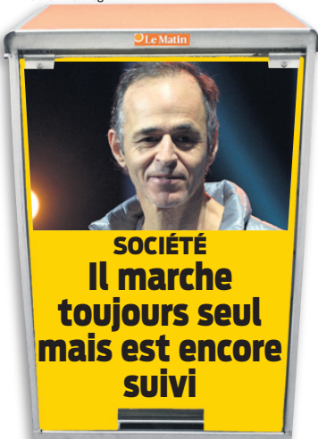
Jean-Jacques Goldman Chanteur

Comme chaque année, le JDD a publié son classement des personnalités préférées des Français. Et, comme chaque année depuis six ans, le chanteur rafle la première place. Un exploit tout de même pour un artiste certes génial mais qui n'a pas sorti de disque depuis plus de quinze ans et dont le seul fait d'armes est l'insupportable soirée annuelle des Enfoirés. Si l'improductivité est une qualité en France, François Hollande peut se réjouir, il sera réélu.