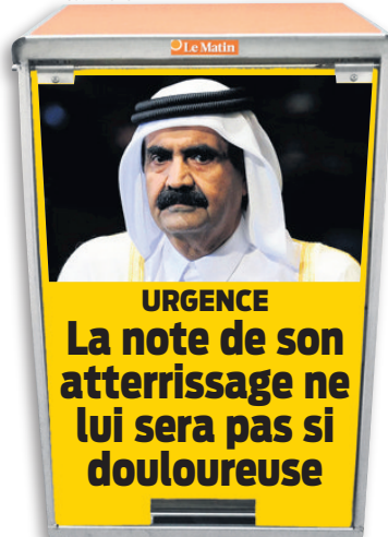
Hamad ben Khalifa al-Thani Ancien émir du Qatar

La famille royale du Qatar va déboursier 13 940 francs pour ses trois atterrissages d'urgence le 26 décembre, alors que l'aéroport de Zurich était fermé. Et, d'après SonntagsBlick, 4500 francs seront perçus pour le bruit durant la nuit. Après s'être cassé la jambe lors de ses vacances au Maroc, l'ancien émir va donc devoir casser sa tirelire. Mais, avec une fortune estimée à plus de 2 milliards de francs, il devrait pouvoir s'en sortir. ● CLÉA FAVRE