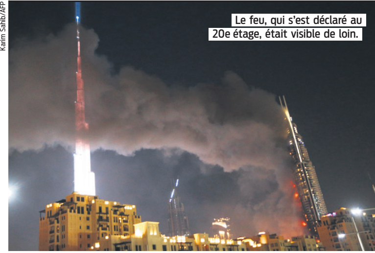
Le feu, qui s'est déclaré au 20 e étage, était visible de loin.