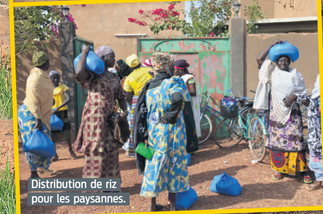
Distribution de riz pour les paysannes.