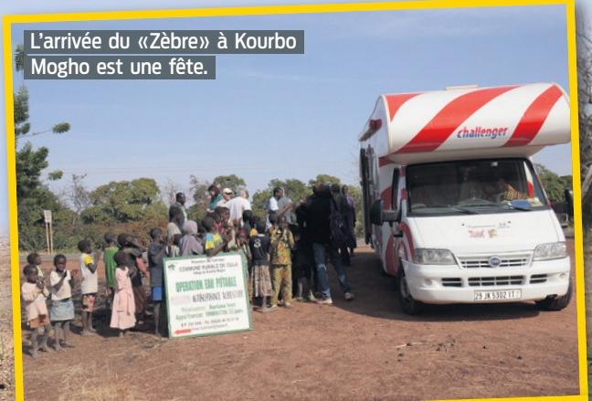
L'arrivée du «Zèbre» à Kourbo Mogho est une fête.