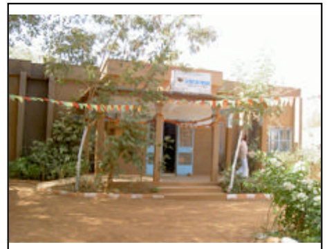
La Voix du Paysan