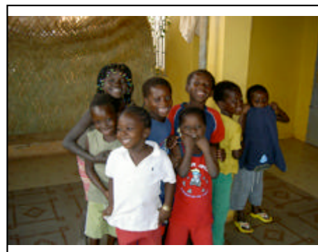
... et les grands