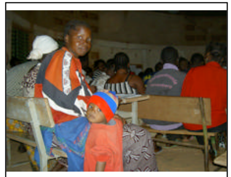
Cours du soir de l'école Ypaala... pour les petits aussi!