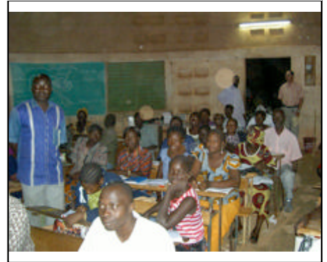
Cours du soir de l'école Ypaala