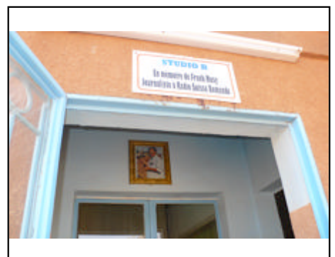
Le studio Frank Musy à la Voix du Paysan

retrouvez toutes ces photos et nouvelles sur notre site internet :