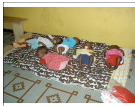
Les plus petits de l'Île du Bonheur