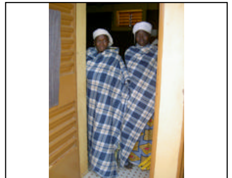
Les couvertures pour les mamans et les enfants du CREN