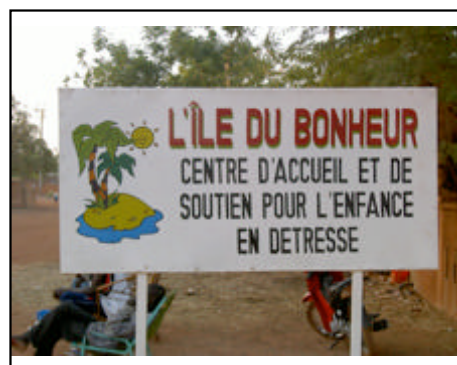
Un orphelinat qui porte bien son nom