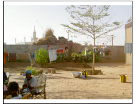
La cour de la maison de Myriam