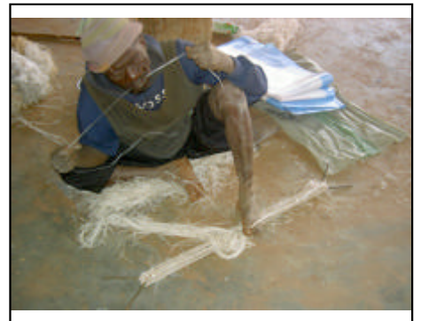
Fabrication des cordes à la cour des aveugles