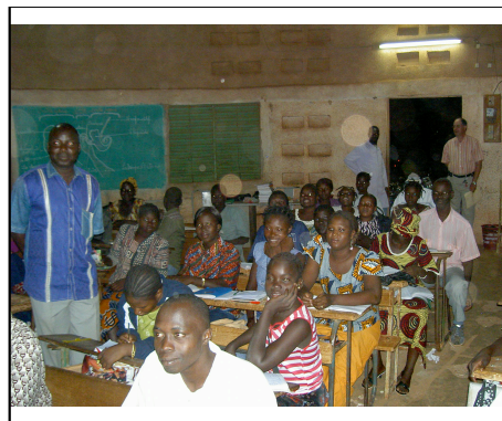
Cours du soir de l'école Ypaala