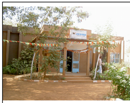
La Voix du Paysan