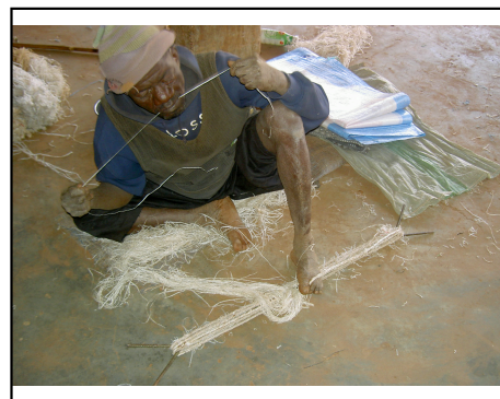
Fabrication des cordes à la cour des aveugles