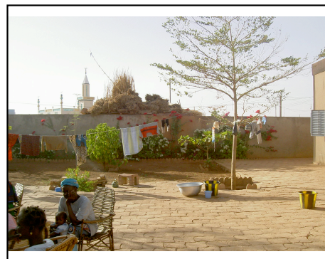
La cour de la maison de Myriam