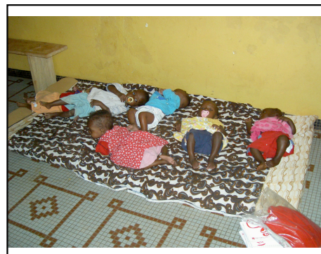
Les plus petits de l'Île du Bonheur