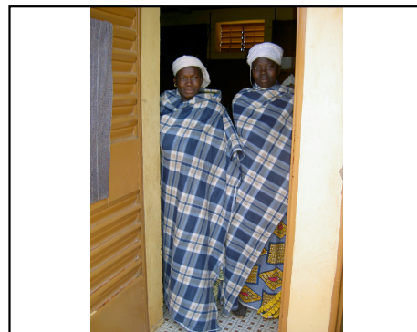
Les couvertures pour les mamans et les enfants du CREN