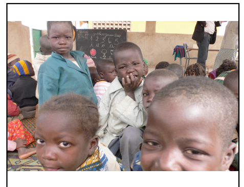
La Perche Communautaire