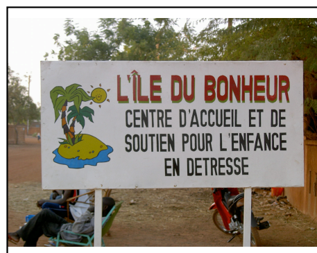
Un orphelinat qui porte bien son nom