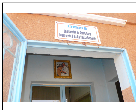
Le studio Frank Musy à la Voix du Paysan

retrouvez toutes ces photos et nouvelles sur notre site internet :