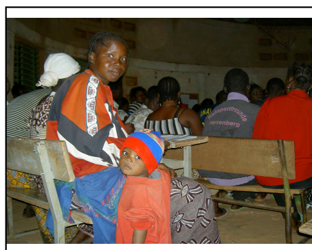
Cours du soir de l'école Ypaala... pour les petits aussi!