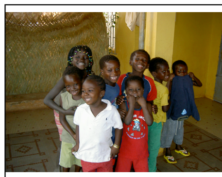
... et les grands