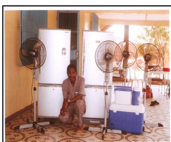
Les frigos, glacières et ventilateurs du Centre Médical de Pédiatrie