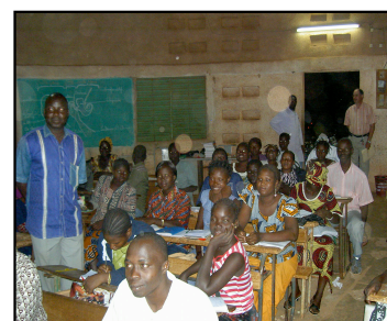
Cours du soir de l'école Ypaala