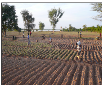
Les sociétaires de Burkina Vert au travail