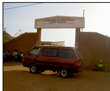
Le véhicule reçu par l'intermédiaire de la RSR, remis en état et descendu par nos soins