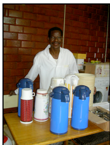
Distribution du matériel reçu par l'intermédiaire de "Chacun pour tous"