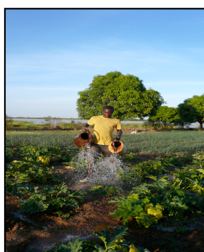
Arrosage du terrain Burkina Vert