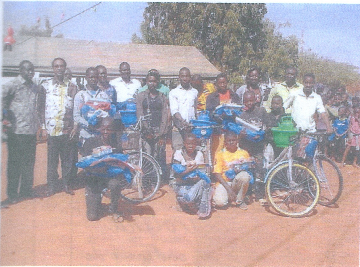
Après une distribution de matériel.