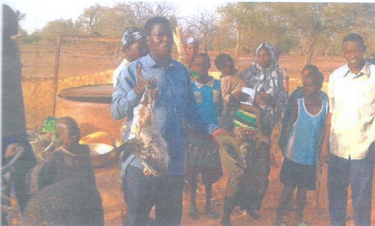
Un présent... en guise d'accueil!

Lundi, c'est le départ! E journée, les véhicules et les feurs embarqueront de Sète- res. Le 3 décembre, tôt le mat seront le pied à Tanger et il le plus de 6000 km de goudron et de pistes avant d'atteindre gouvaya. Alors, prudence voyage! ■